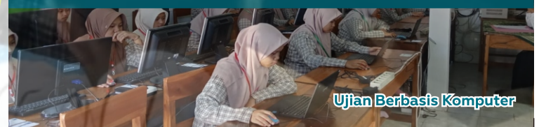
Ujian Berbasis Komputer

https://bit.ly/Formulir_SantriBaru_PPKHI