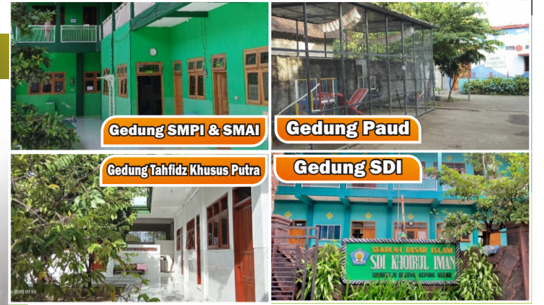
Gedung SMPI & SMAI